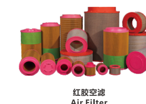
红胶空滤 Air Filter