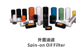
外置油滤 Spin-on Oil Filter