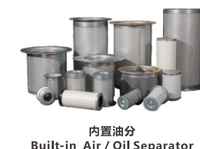
内置油分 Built-in Air / Oil Separator