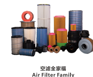
空滤全家福 Air Filter Family