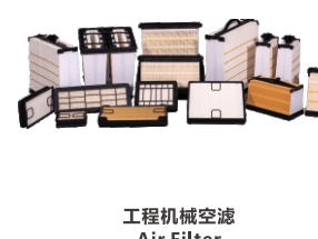
工程机械空滤 Air Filter