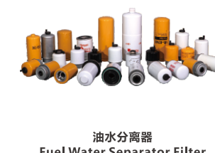
油水分离器 Fuel Water Separator Filter