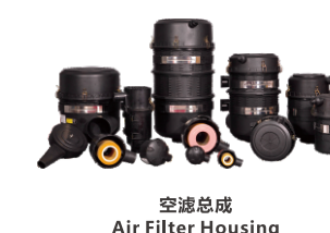
空滤总成 Air Filter Housing