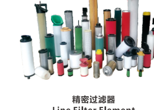
精密过滤器 Line Filter Element