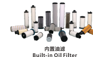
内置油滤 Built-in Oil Filter