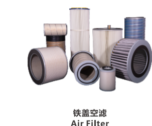
铁盖空滤 Air Filter