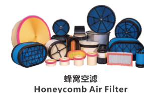
蜂窝空滤 Honeycomb Air Filter