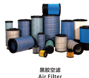
黑胶空滤 Air Filter