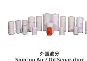
外置油分 Spin-on Air / Oil Separator