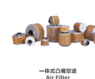
一体式凸嘴空滤 Air Filter