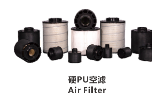
硬PU空滤 Air Filter